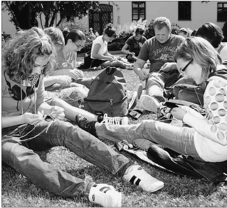
Wer Lust hatte, konnte beim Jugendtag der Diözese auch Freundschaftsbänder knüpfen.