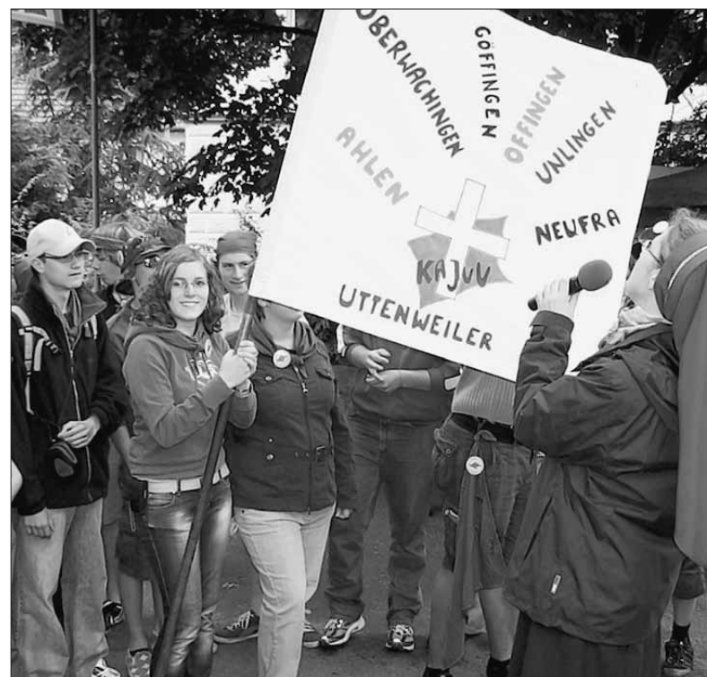
Aus allen Teilen der Diözese Rottenburg-Stuttgart kamen die Jugendlichen am Wochenende ins Kloster Untermarktal.

Mit Liedern und Tänzen kündigten sich die einzelnen Gruppen der fast 2000 Jugendlichen an. Den weitesten Weg hatten die Gruppen aus Bad Mergentheim, Friedrichshafen und Neresheim hinter sich. „Wir sind