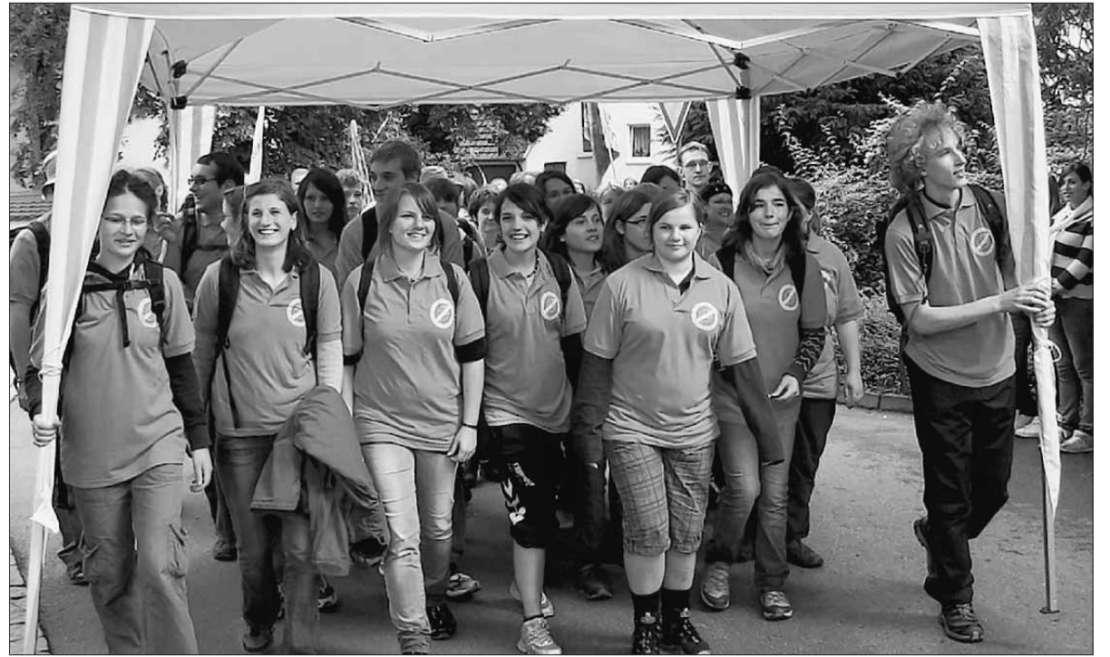
Ein ganzer Pavillon als Schutz: So trotzten einige Jugendliche dem Regen am Samstag, auch als sie noch unterwegs zu den Veranstaltungen des Jugendtags in Untermarktal waren.