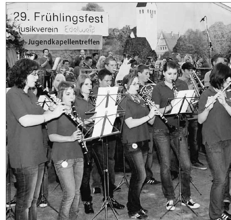
Der Gesamtchor aller vier musizierenden Jugendkapellen beeindruckte die Besucher des Frühlingsfests in Rottenacker.